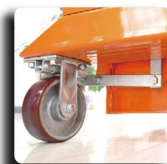
自动刹车系统-选配